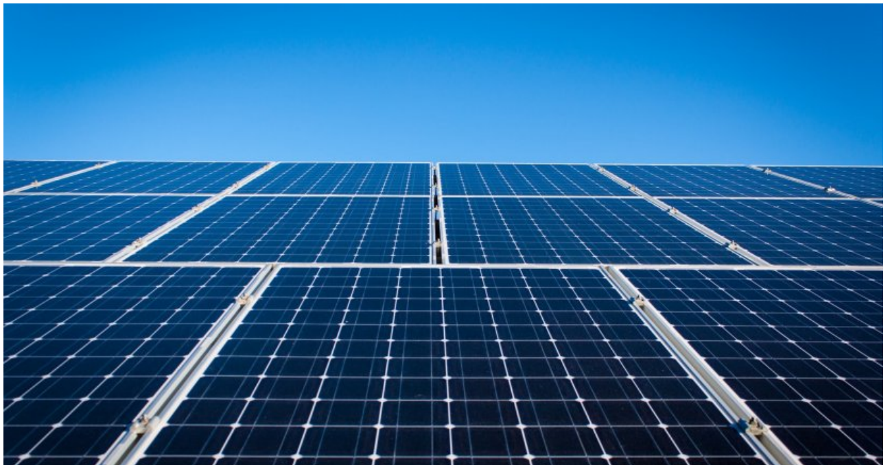
Placas solares fotovoltaicas

Preestudio de instalación fotovoltaica, presupuesto y viabilidad para el Ayuntamiento