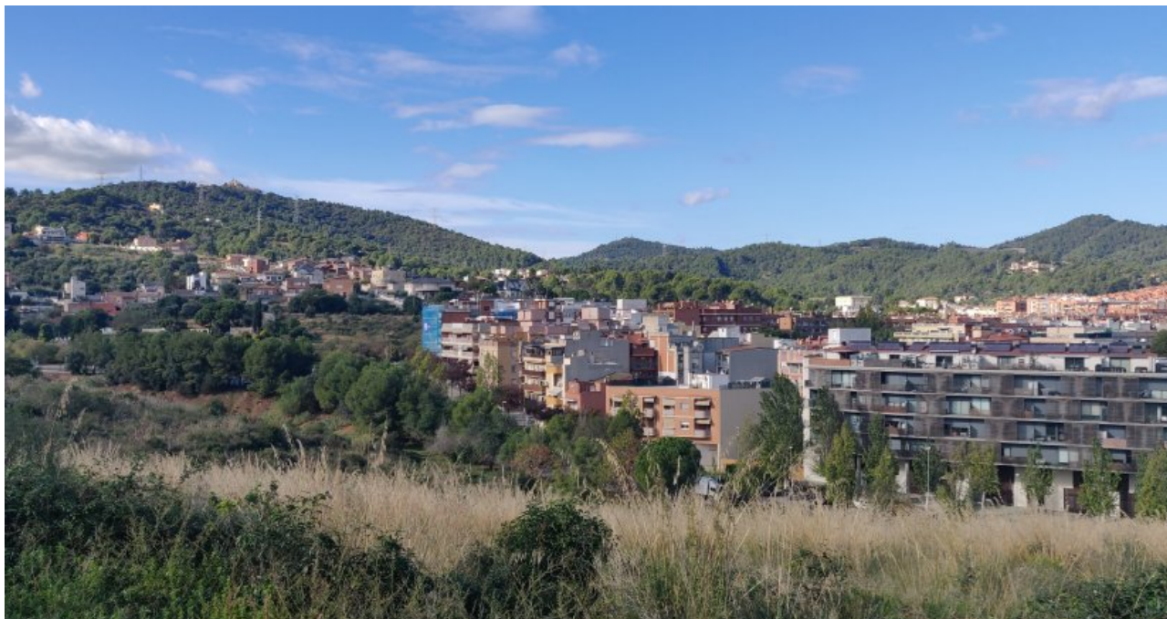
• Entorn de la Riera de Can Soler, a Sant Boi de Llobregat