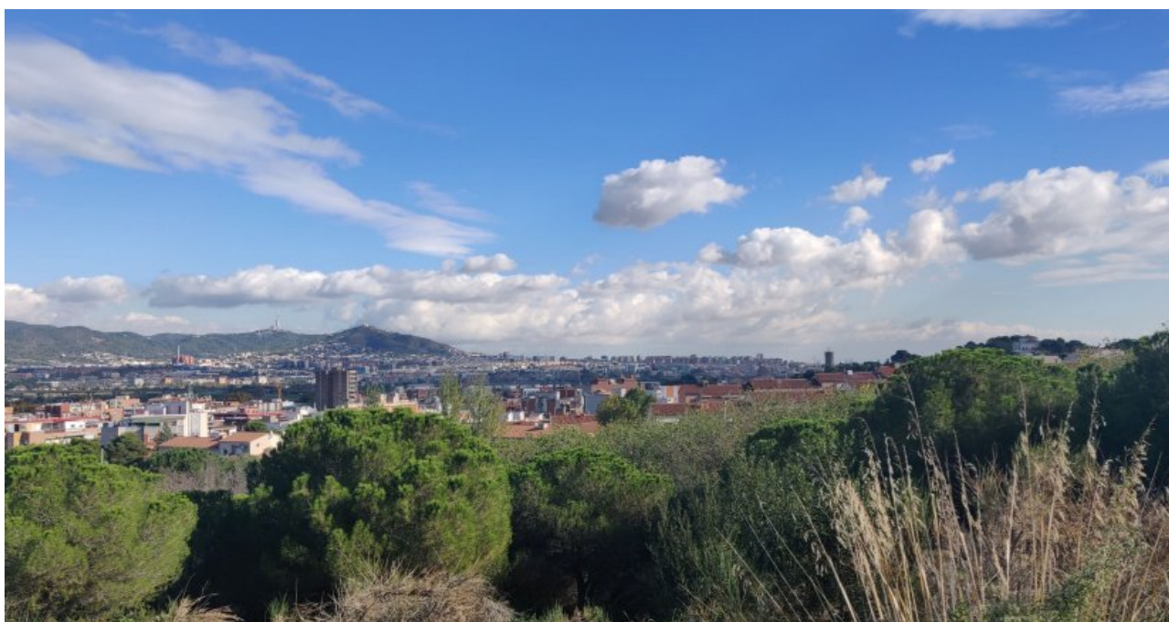
• Entorn de la Riera de Can Soler, a Sant Boi de Llobregat